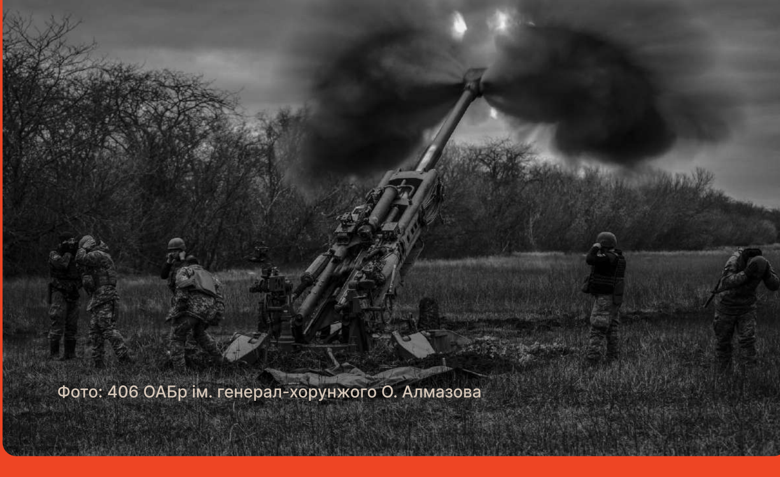
Фото: 408 ОБрІм, генерал-хорунжого О. Алмазова